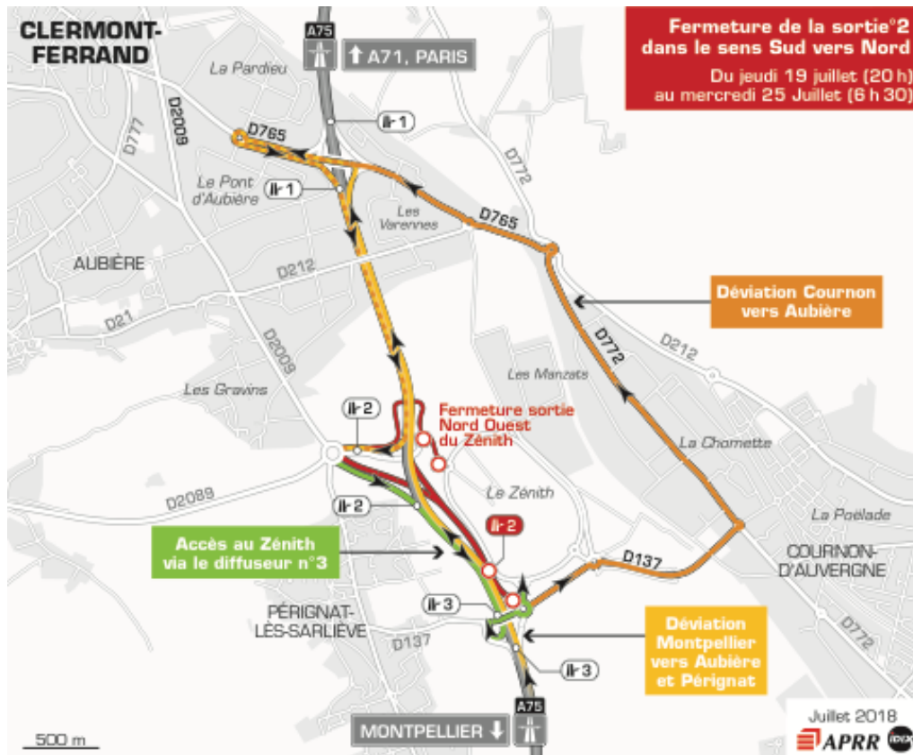
Ci-dessous, focus sur la zone du Zénith